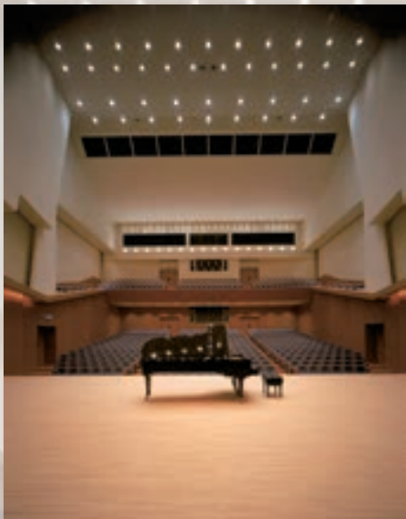
本選・受賞記念演奏会 会場 (東邦音楽大学グラントゥザール)