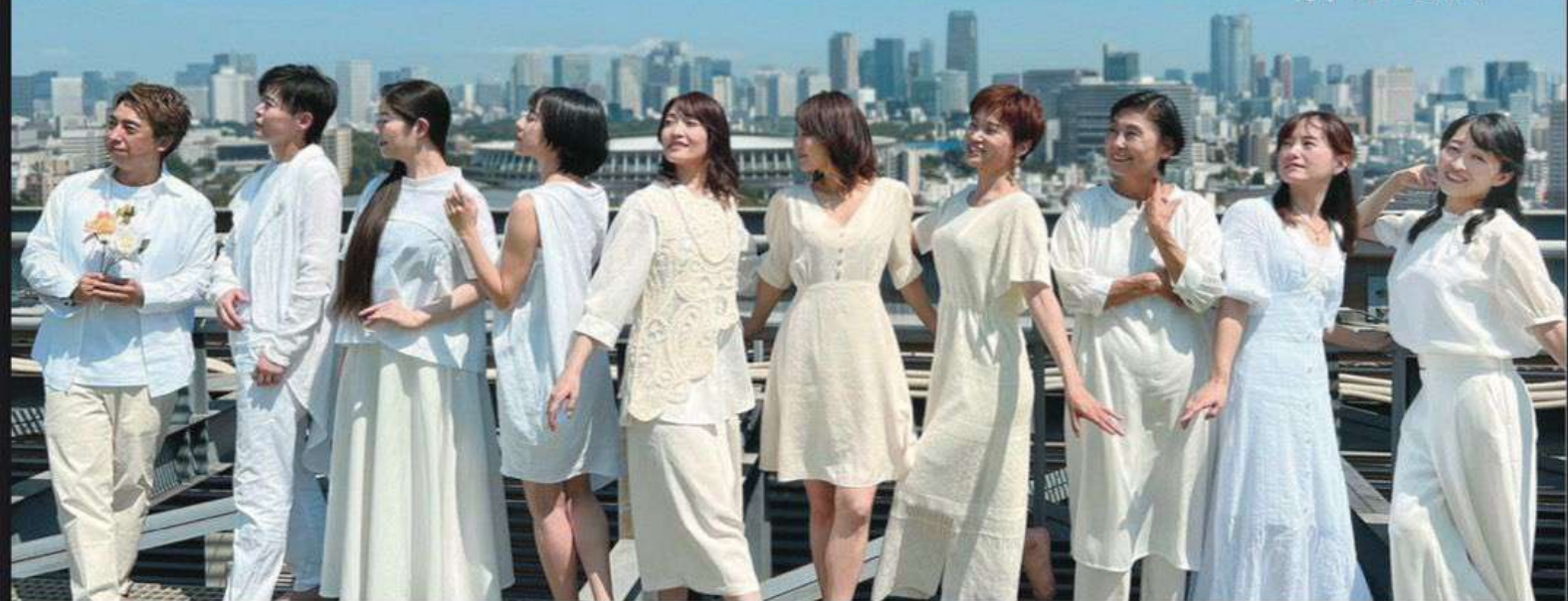
舞台収益の一部はバヤタスの子どもたちへの学校支援として使われます。