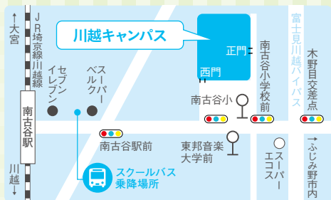
◆キャンパス周辺図